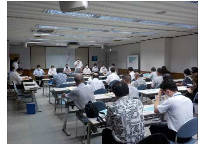
地権者へ説明 (ひたちなか市栄町説明会)