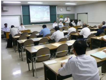
移転対象者へ説明 (大場遊水地説明会)