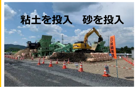
粘土を投入 砂を投入