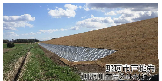
那珂市戸地先 (那珂川左岸24㍎付近)