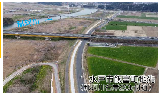
水戸市飯富町地先 (那珂川右岸20㍎付近)