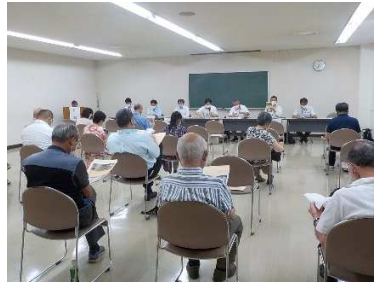
地権者へ説明 (水戸市根本・ちとせ地区説明会)