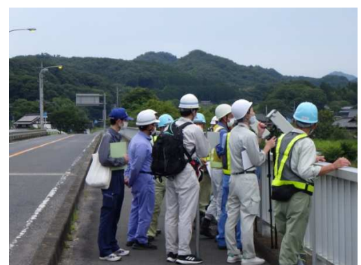
観測の体験の様子