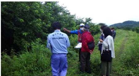
下伊勢畑地区 立会状況